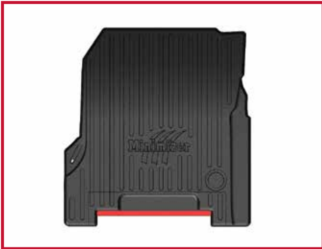
Figure 8 – Schéma de découpage du tapis côté passager

22. Installer le crochet de retenue du tapis côté passager, comme montré à la Figure 9. Répéter les étapes 9 à 16 ci-dessus pour fixer correctement le crochet à la moulure en plastique près du plancher du camion.