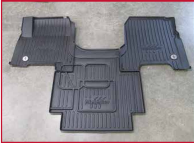
Figure 1 – Trousse de tapis protecteurs 10002792