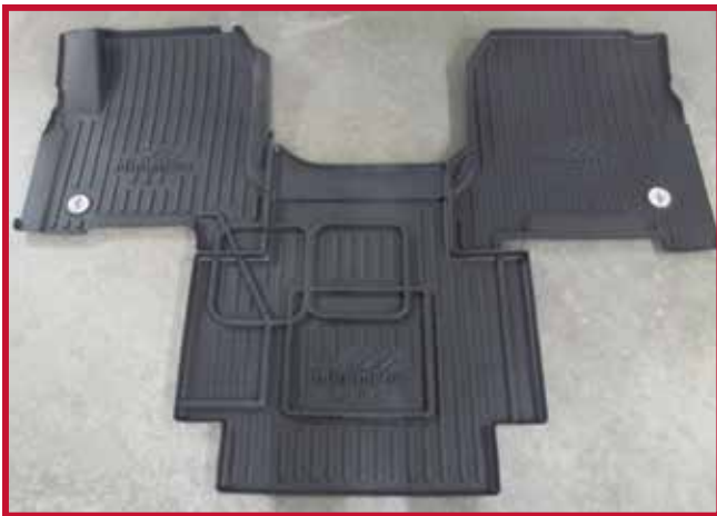
Figure 2 – Trousse de tapis protecteurs 10002798