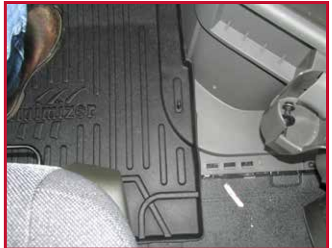
Figure 7 – Installation du crochet du tapis côté conducteur

18. Tirer le tapis côté conducteur vers l'arrière du camion pour confirmer que le crochet est entièrement engagé dans le tapis et que le crochet est collé à la moulure. Si le crochet ne fonctionne pas correctement ou si le tapis ne peut pas être installé de manière sûre, ne pas utiliser de tapis protecteur Minimizer du côté conducteur du véhicule.