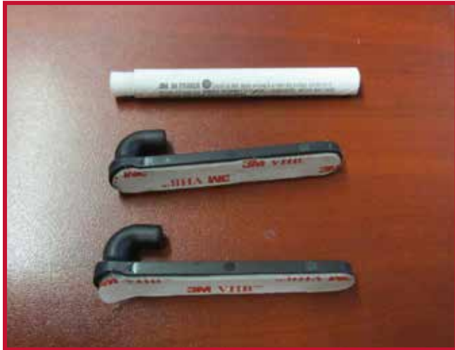
Figure 5 – Crochet de retenue et Apprêt 94

8. Insérer un crochet dans le trou situé au bord droit du tapis côté conducteur. Le crochet doit être placé à affleurement de la face inférieure du tapis côté conducteur.