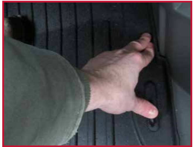
Figure 6 – Appliquer une pression sur le crochet

17. Pour une adhérence optimale, ne pas déranger le crochet pendant une période de 20 minutes après l'installation. La Figure 7 ci-dessous montre le tapis côté conducteur et le crochet correctement installés.