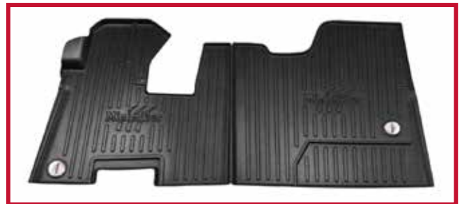
Figure 6 – Trousse de tapis protecteurs 10002652