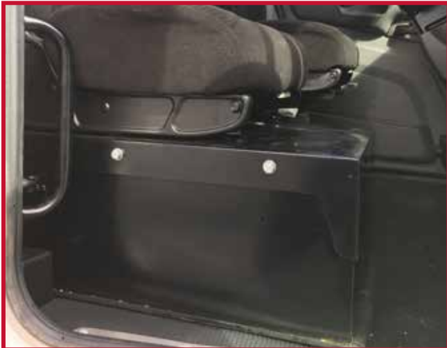
Figure 8 – Base de siège du passager avec caisson de batterie