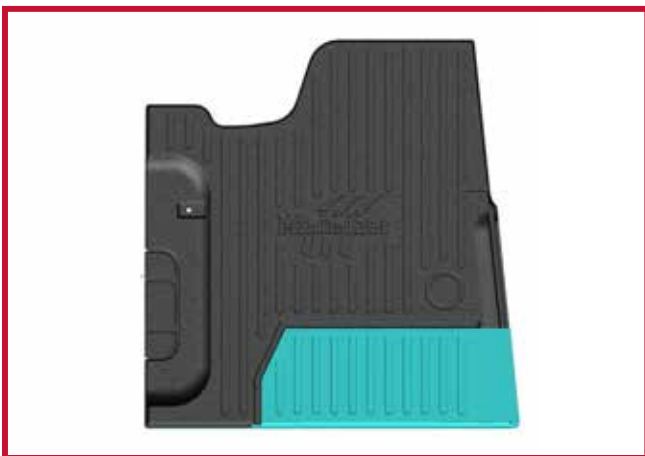
Figure 9 – Schéma de découpage