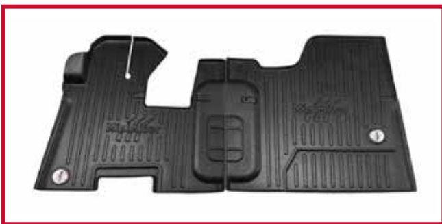
Figure 10 – Trousse de tapis protecteurs 10002655