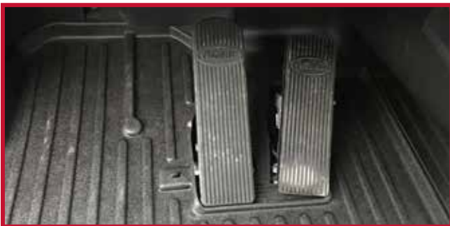
Figure 14 – Tapis côté conducteur installé avec le crochet

12. Tirer sur le tapis côté conducteur pour confirmer que le crochet est entièrement engagé dans le tapis. Si le crochet ne fonctionne pas correctement ou si le tapis ne peut pas être installé de manière sûre, ne pas utiliser de tapis protecteur Minimizer du côté conducteur du véhicule.