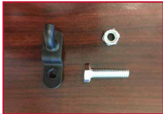
Figure 11 – Crochet de retenue et quincaillerie