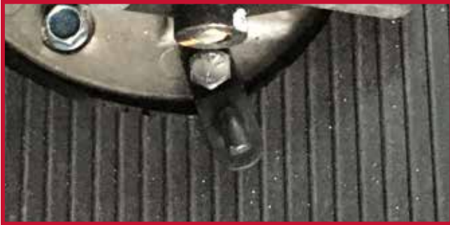
Figure 13 – Crochet de retenue et quincaillerie

11. Placer le tapis côté conducteur dans le camion et fixer le tapis au crochet de retenue.