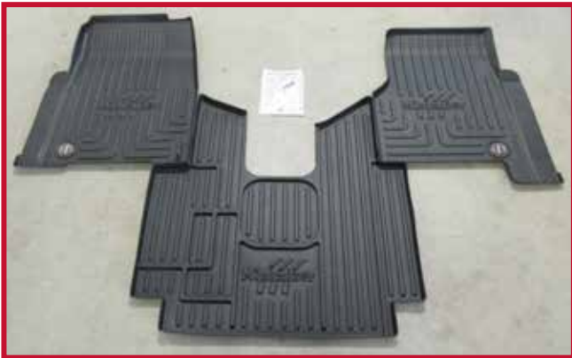
Figure 2 – Contenu de la trousse #10002231