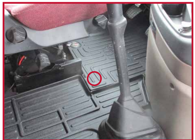
Figure 10 – Confirmer l'emplacement du tapis côté conducteur et du crochet

11. Marquer l'emplacement approximatif où le crochet doit être fixé au plancher avec un doigt. Une fois l'emplacement localisé, retirer le tapis côté conducteur du camion.