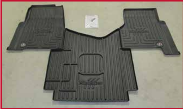
Figure 1 – Contenu de la trousse #10002211