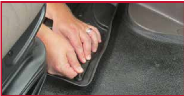
Figure 11 – Appliquer une pression sur le crochet

18. Pour une adhérence optimale, ne pas déranger le crochet pendant une période de 20 minutes après l'installation. La Figure 12 ci-dessous montre l'installation correcte du crochet.