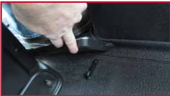
Figure 12 – Crochet correctement installé

18. Pour une adhérence optimale, ne pas déranger le crochet pendant une période de 20 minutes après l'installation. La Figure 12 ci-dessous montre l'installation correcte du crochet.