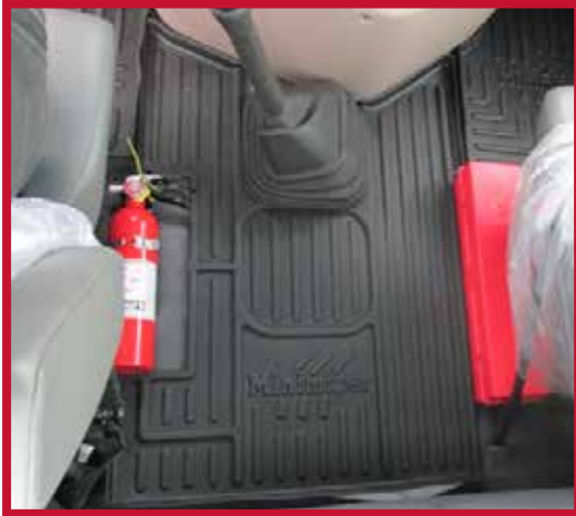
Figure 5 – Tapis central découpé et installé

6. Redresser le soufflet en caoutchouc qui entoure le levier de vitesse de manière à ce qu'il repose sur le dessus du tapis central, comme montré à la Figure 6.