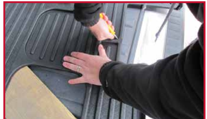
Figure 4 – Découpage avec couteau utilitaire

Remarque : En utilisant les bords des nervures hautes comme guide, découper la partie voulue du tapis à l'aide d'un couteau utilitaire aiguisé, comme indiqué à la Figure 4. Toujours couper le long de la limite intérieure de la zone ombragée. La nervure haute sera ainsi préservée afin d'aider à contenir tout liquide déversé.