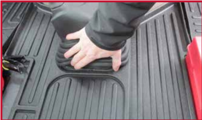
Figure 6 - Redressement du soufflet en caoutchouc

7. Placer le tapis côté conducteur dans le camion, comme montré à la Figure 7.