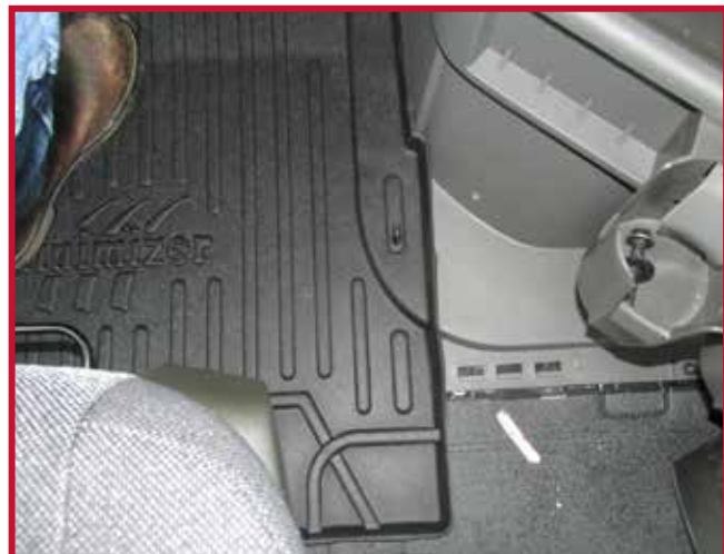
Figura 7 - Instalación del gancho del tapete del conductor