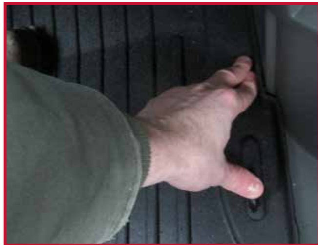
Figura 6 - Aplicar presión al gancho