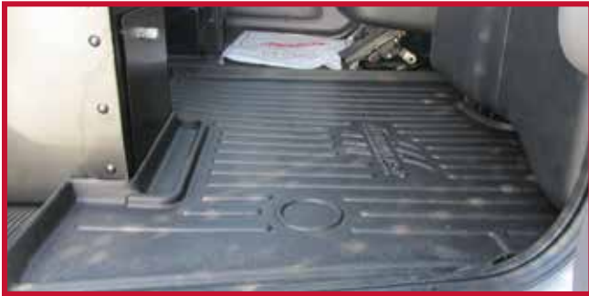
Figura 2 - Asiento del pasajero con compartimento de almacenamiento