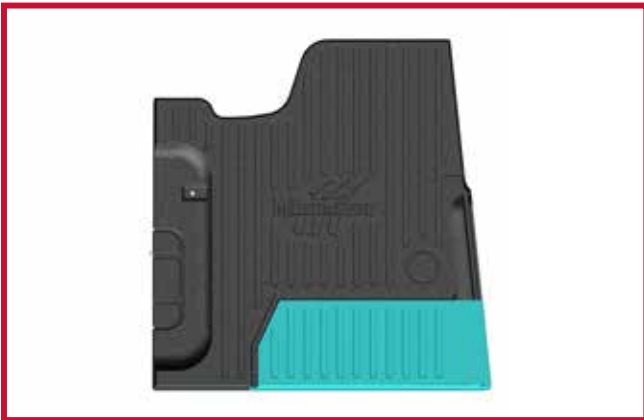
Figura 9 - Diagrama de recorte