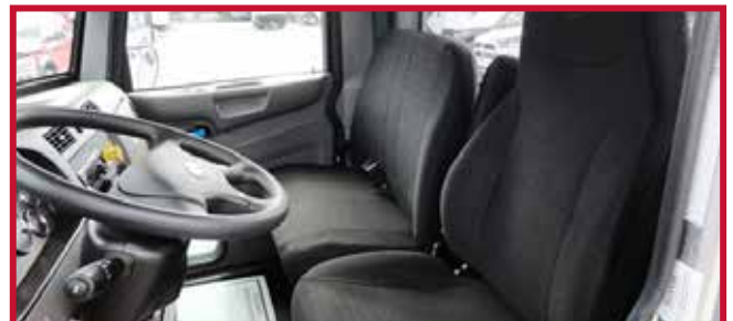
Figura 7 - Asiento de banco para dos personas