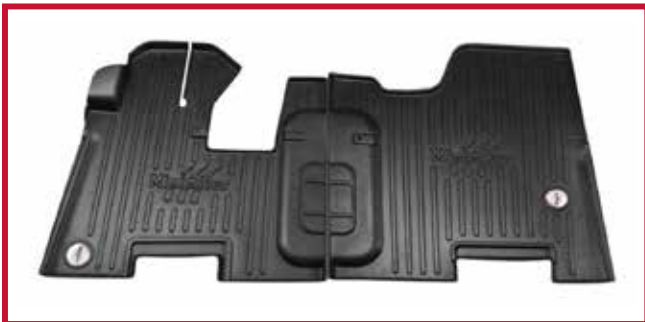
Figura 4 - Kit de tapetes 10002650