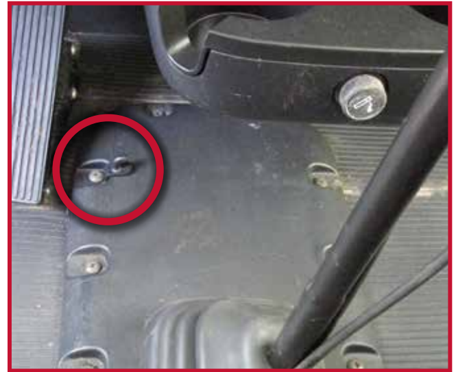
Figura 15 - Perno de montaje del pedal de freno

17. Antes de utilizar el vehículo, lea las instrucciones de seguridad para el manejo del vehículo.