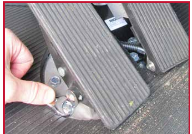
Figura 12 - Perno de montaje del pedal de freno