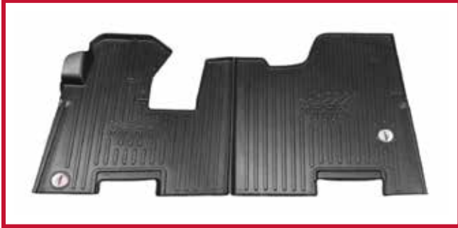
Figura 1 - Kit de tapetes 10002732