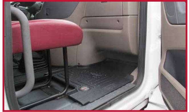
Figura 13 - Tapete de pasajero con asiento fijo

20. Tire del tapete del conductor hacia la parte delantera del camión para confirmar que el gancho está completamente encajado en el tapete y que el gancho está adherido al piso. Si el gancho no funciona correctamente o el tapete no puede instalarse de forma segura, no utilice un tapete Minimizer en el lado del conductor del vehículo.