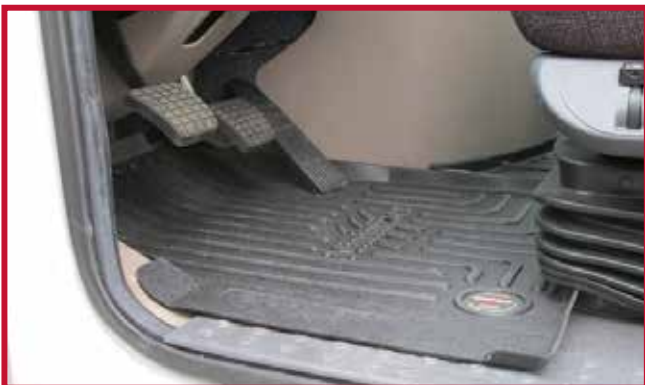
Figura 7 - Tapete del conductor en posición

8. Dentro del paquete con las instrucciones de instalación, localice un gancho de retención de plástico negro así como un tubo blanco de Primer 94 como se muestra en la Figura 8.