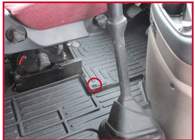
Figura 10 - Instalación del gancho del conductor

11. Marque con un dedo la posición aproximada en la que deberá fijarse el gancho al piso. Una vez localizada la posición, retire el tapete del conductor del camión.