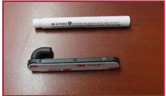
Figura 8 - Gancho y aplicación de Primer 94

9. Introduzca el gancho a través del orificio situado en la esquina trasera derecha del tapete del conductor, como se muestra en la figura 9. El gancho debe quedar al ras de la parte inferior del tapete del conductor.