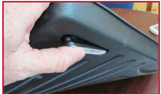
Figura 9 - Inserción del gancho

10. Una vez colocado el gancho, deje que el tapete del conductor y el gancho se apoyen en el piso, como se muestra en la figura 10.