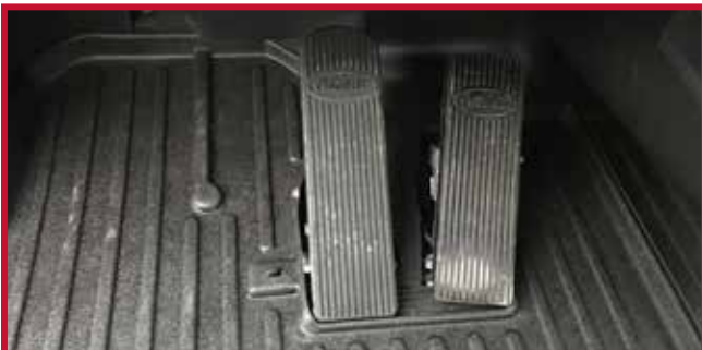
Figura 14 - Tapete del conductor instalado con gancho

12. Tire del tapete del conductor para confirmar que el gancho está completamente encajado en el tapete. Si el gancho no funciona correctamente o el tapete no puede instalarse de forma segura, no utilice un tapete Minimizer en el lado del conductor del vehículo.