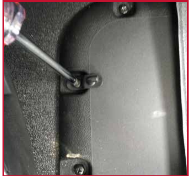
Figura 8 - Instalación del gancho de retención

d) Termine de instalar el tapete del lado del conductor y engánchelo en el gancho de retención. El tapete del conductor debe empujarse completamente hacia adelante para que el borde delantero haga pleno contacto con los paneles inferiores del salpicadero, como se muestra en la figura 9.