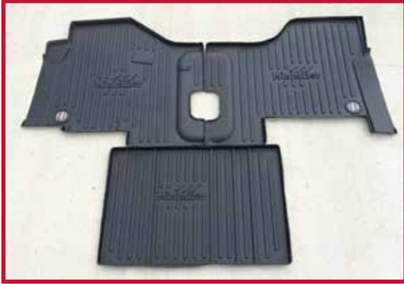
Figura 1 - Contenido del KIT FKPCR1MB