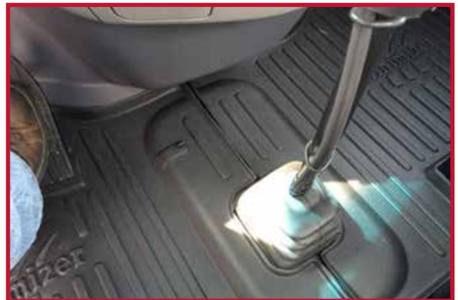
Figura 9 - Kit FKPCR1MB Tapete de conductor con gancho de retención

d) Termine de instalar el tapete del lado del conductor y engánchelo en el gancho de retención. El tapete del conductor debe empujarse completamente hacia adelante para que el borde delantero haga pleno contacto con los paneles inferiores del salpicadero, como se muestra en la figura 9.