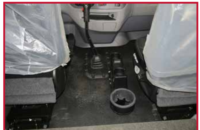
Figura 5 - Soporte para termos