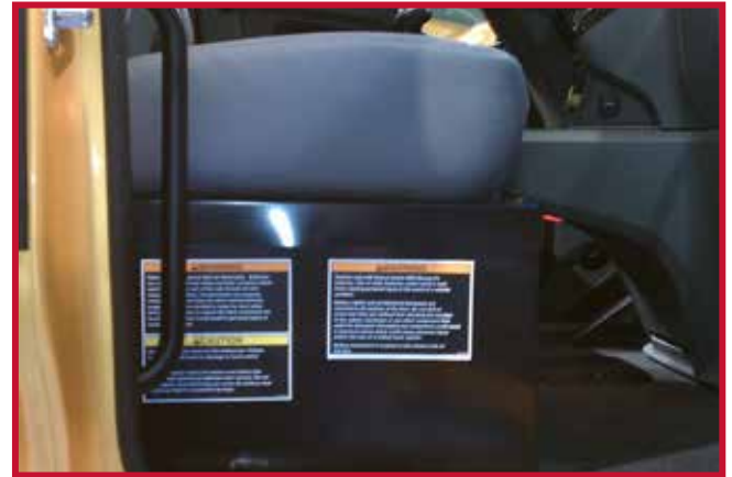
Figura 4 - Asiento del pasajero con almacenamiento de la batería