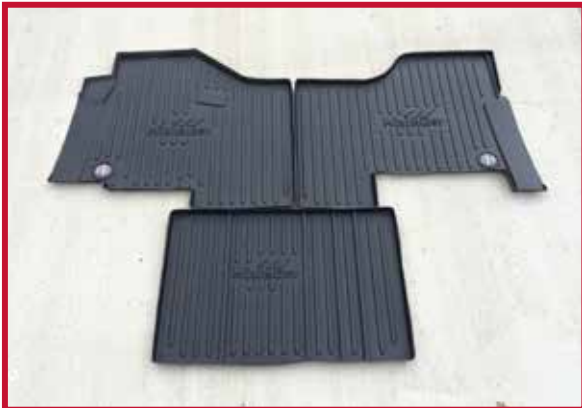
Figura 2 - Contenido del KIT FKPCR1AB