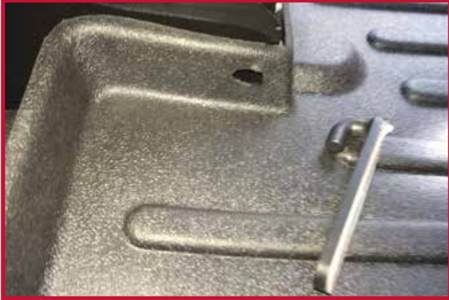
Figura 10 - Tapete del conductor con abertura para el gancho

d) El gancho de retención se fijará en el lado derecho de la base del asiento del conductor. En la pared vertical del tapete del conductor hay un orificio ranurado, como se muestra en la figura 10.