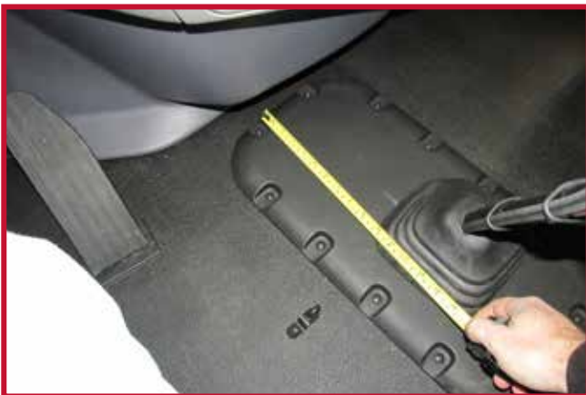
Figura 7 - Conjunto de gancho y espaciador

b) Localice el gancho de retención suministrado en el kit del tapete del piso. Introduzca el tornillo a través del orificio del gancho de retención y vuelva a colocar el tornillo en la cubierta de la transmisión. Apriete el