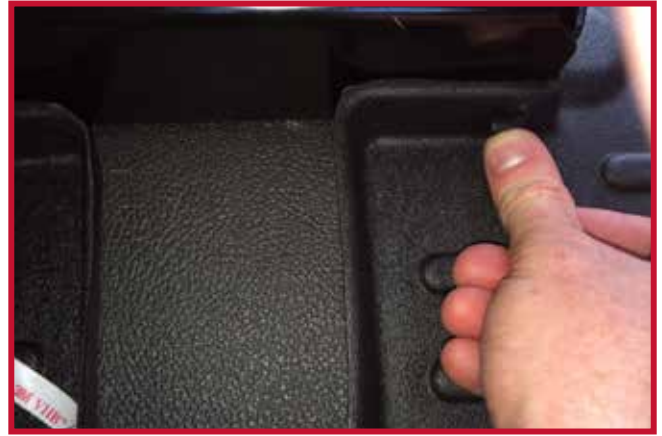
Figura 11 - Aplicar presión al gancho