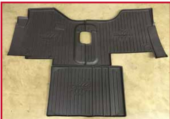
Figura 3 - Contenido del KIT #104830