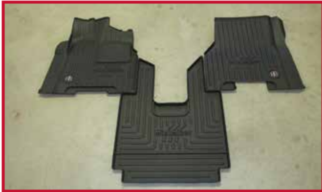
Figure 1 – Contenu de la trousse FKFR3L3MB