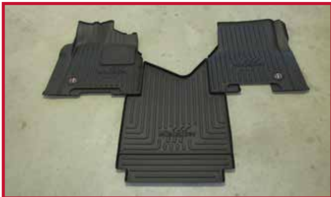
Figure 2 – Contenu de la trousse FKFR3L3AB