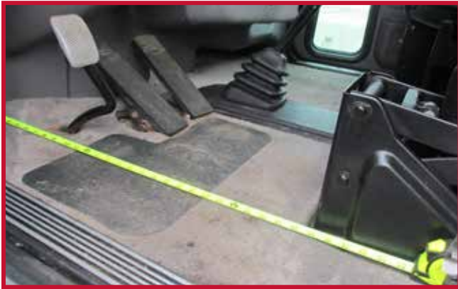
Figura 1 - Medición del asiento del conductor

Consulte la figura 1 para ver las instrucciones de medición del asiento del conductor.