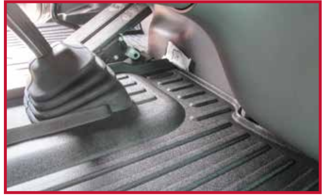
Figura 8 - Ajuste después del recorte

8. A continuación, instale el tapete para el lado del pasajero del vehículo como se muestra en la figura 9.