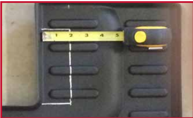
Figura 7 - Medidas de recorte

7. En los casos en los que se monte un extintor detrás del asiento del conductor, la esquina trasera izquierda del tapete central sombreada en amarillo puede recortarse para dejar espacio libre.