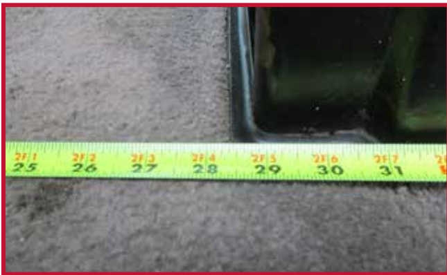
Figura 2 - 28,75" medida en la parte delantera de la base del asiento