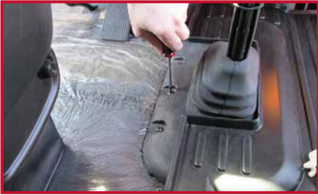
Figura 11 - Extracción del tornillo

b) Introduzca el tornillo a través del orificio del gancho de retención como se muestra en la figura 12.