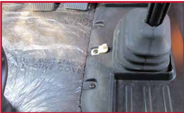
Figura 13 - Orientación correcta del gancho

10. Instale el tapete del lado del conductor y engánchelo en el gancho de retención. El tapete del conductor debe empujarse completamente hacia delante para que el borde delantero haga pleno contacto con los paneles inferiores del salpicadero. Si se instala el kit FKPB2B o 104104, encaje el borde derecho del tapete sobre el borde izquierdo del tapete del pasajero para bloquear los tapetes. Si se instala el kit FKPB3B o 104105, encaje el borde izquierdo del tapete del pasajero sobre la parte superior del tapete del conductor.