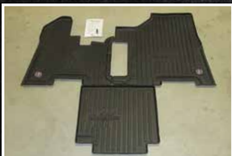
Figure 2 – Contenu de la trousse FKPB6B