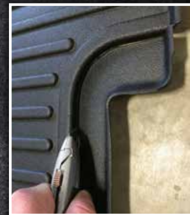
Figure 8 – Découpage pour les sièges du marché de l'après-vente

10. Tirer le tapis protecteur côté conducteur vers la gauche pour s'assurer que le crochet de retenue est entièrement engagé et solidement fixé au plancher. Si le crochet ne fonctionne pas correctement ou si le tapis ne peut pas être installé de manière sûre, ne pas utiliser de tapis protecteur Minimizer du côté conducteur du véhicule.