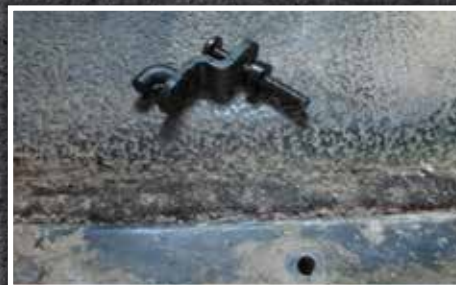
Figure 6 – Assemblage de crochet et d'espaceur

c) Insérer l'assemblage de crochet dans le couvercle de la boîte de vitesses, puis serrer à l'aide d'un tournevis Phillips n° 3. Orienter le crochet du tapis protecteur de manière à ce qu'il pointe directement vers le levier de vitesse, comme montré à la Figure 7.