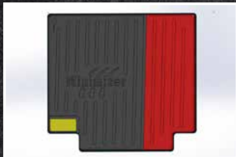
Figure 4 – Schéma de découpage

7. Ensuite, installer le tapis côté passager du véhicule.