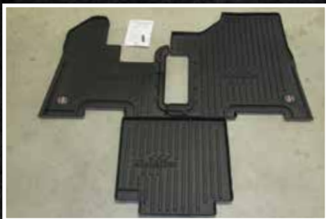
Figure 1 – Contenu de la trousse FKPB5B