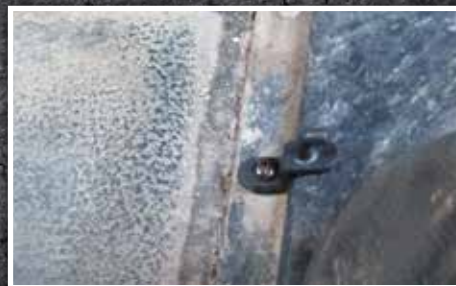
Figure 7 – Orientation appropriée du crochet

9. Installer le tapis protecteur côté conducteur, puis l'engager dans le crochet de retenue. Si l'emplacement de la base du siège n'est pas standard ou si le camion est équipé de sièges du marché de l'après-vente, il peut être nécessaire de découper la partie arrière du tapis côté conducteur ou côté passager pour assurer un ajustement adéquat. Une nervure surélevée est moulée dans le tapis côté conducteur et le tapis côté passager pour le confinement des liquides et pour servir de guide de découpage. Utiliser un couteau à lame rétractable bien aiguisée, comme montré à la Figure 8, pour découper le matériau et couper le long du bord extérieur de la nervure surélevée en préservant la nervure pour le confinement des liquides.