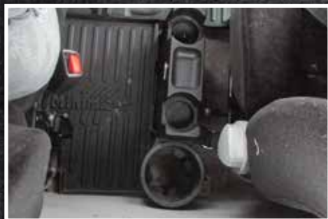
Figure 3 – Porte-bouteille isolante d'usine

6. Dans les cas où un extincteur est monté derrière le siège du conducteur, le coin arrière gauche ombré jaune du tapis central peut être découpé pour permettre un dégagement.