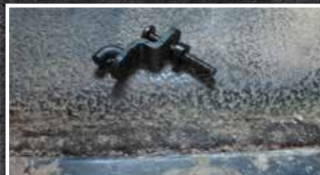
Figura 6 - Conjunto de gancho y espaciador

c) Introduzca el conjunto del gancho a través de la tapa de la transmisión y apriételo con un desarmador Phillips n° 3. Oriente el gancho del tapete para que apunte directamente hacia la palanca de cambios, como se muestra en la figura 7.