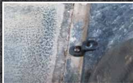
Figura 7 - Orientación correcta del gancho

9. Instale el tapete del lado del conductor y encájelo en el gancho de retención. Si la posición de la base del asiento no es estándar o si el camión está equipado con asientos del mercado de accesorios, puede ser necesario recortar la parte trasera del tapete del conductor o del pasajero para que encaje. El tapete del conductor y del pasajero tiene un borde elevado para contener los líquidos y servir de guía para el corte. Utilice una navaja afilada como se muestra en la figura 8 para recortar el material y cortar a lo largo de la parte exterior del borde elevado, preservando el borde para la contención de líquidos.