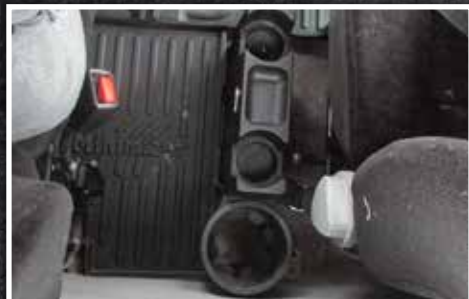
Figura 3 - Soporte para termos de fábrica

6. En los casos en los que se monta un extintor detrás del asiento del conductor, la esquina trasera izquierda del tapete central sombreada en amarillo puede recortarse para dejar espacio libre.