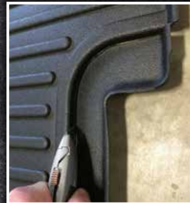
Figura 8 - Corte para los asientos del mercado de accesorios

10. Tire del tapete del lado del conductor hacia la izquierda para confirmar que el gancho de retención está totalmente encajado y bien sujeto al piso. Si el gancho no funciona correctamente o el tapete no puede instalarse de forma segura, no utilice un tapete Minimizer en el lado del conductor del vehículo.