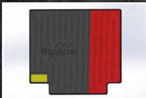
Figura 4 - Diagrama de recorte

7. A continuación, instale el tapete para el lado del pasajero del vehículo.